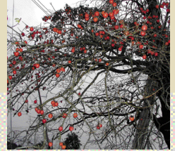
御稜柿 毎年10月17日に行われる「さあござれ」の儀式の中で、粟鹿神社に奉納される御稜柿。粟鹿神社の七不思議にも登場し、今だかつて、実がならなかったことがないという。