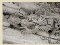
派手な彫刻で飾られている