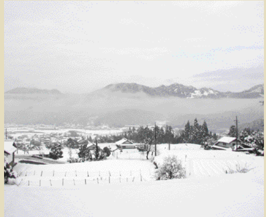
雪化粧した粟鹿盆地