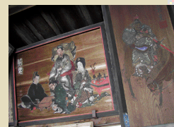
絵馬がたくさんかけられている