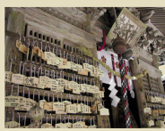
當勝神社の名のもと、受験生たちが合格祈願に訪れる