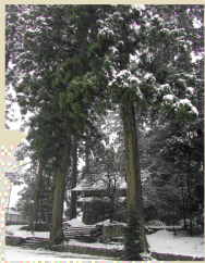
粟鹿神社をとりまく社叢林、大木が立ち並ぶ