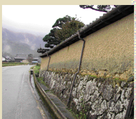
昔の大地主・日下家の屋敷堀つたいに當勝神社への道が続く