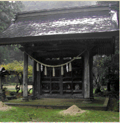
地元では「開かずの門」と呼ばれる勅使門。町の文化財に指定されている。