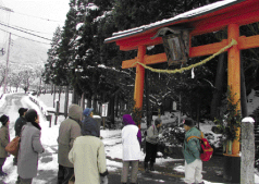
當勝神社の鳥居の下、熱心に話を聞く参加者の皆さん