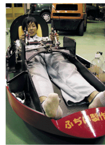
大会では最も体重の軽い部員がドライバーを務める。約20キロ(45分間)をこの体勢で運転する。