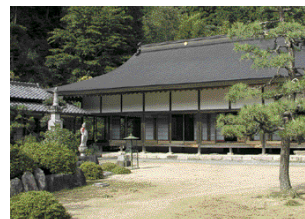
数珠繰りが行われる朝来町上岩津の鷲原寺

すべての行事を終えると、時間はすでに深夜。今年1年のご祈禱を終えた信徒らは、静かに家路につきます。