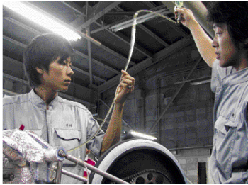
放課後、車のメンテナンスに励む部員の皆さん