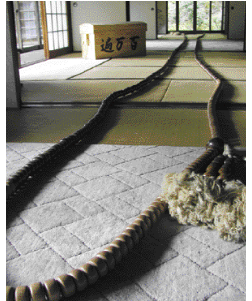
4部屋のふすまを開け放して、やっと広げられる大数珠

お寺では全員に暖かい小豆粥が振る舞われ、福引きを楽しんだ後、いよいよ数珠繰りが始まります。 広間に出されるのは1周30メートルほどの