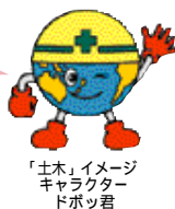
「土木」イメージキャラクター ボツ君

兵庫県内の一般国道9号では、12月から3月までの期間を雪害対策実施として、円滑な道路交通を確保するため、迅速かつ適切な除雪活動を行います。