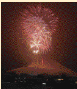
奥神鍋スキー場感謝祭

兵庫県知事杯争奪奥神鍋 ジャイアントスラローム大会 3月1日(月) 日高町奥神鍋スキー場 (問)奥神鍋 TEL.0796-45-0510