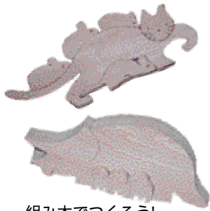
組み木でつくろう!