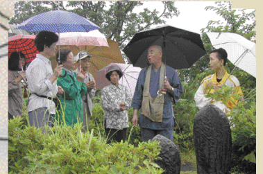
ご住職のお話を熱心に聞く参加者の皆さん