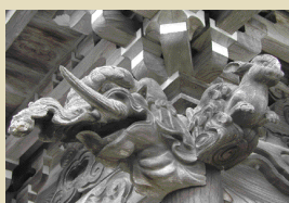
山門のバクとうさぎの彫刻 うさぎは大変珍しいとか