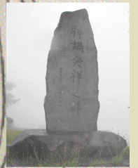
神鍋参祥之地の石碑