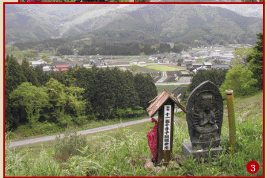
1. ひっそりとたたずむ六番観音様 2. 二十番観音様 3. 五番観音様から眺める神鍋高原の景色も素晴らしい