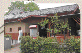
スカイウェイで道の駅神鍋高原とつながり、 ますます便利になったかなべ湯の森ゆとりぎ