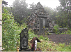
神鍋神社と十七番観音様