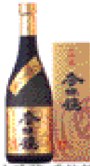
大吟醸 香住鶴 1.2L 店頭小売価格 3,000円