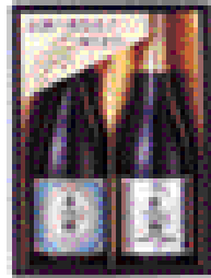
但馬株式の贈り物 香住鶴 大吟醸 1.2L 4,000円 純米大吟醸 1.2L 4,000円