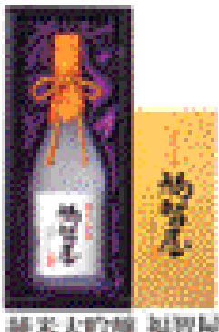
純米大吟醸 福智屋 1.2L 店頭小売価格 5,000円