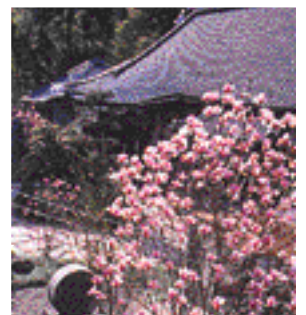
八鹿町高照寺の木蓮