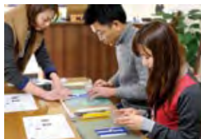
スタッフが丁寧に教えてくれるので、誰でも簡単にできるのが魅力的。