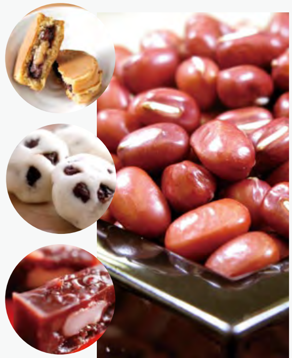
「手まき・手摘み・手より」の手作業で、一粒一粒丁寧に作っている美方大納言小豆は、ルビー色の見た目から「畑の宝石」と言われている。

大きな粒で鮮やかな色合いがきれいな「美方大納言小豆」。兵庫県北部に位置する美方郡は、高原や棚田など自然豊かで変化に富んだ地形に恵まれており、古くから良質な小豆が栽培されてきた。 アミノ酸や甘み成分のほか、老化防止にもよいとされるポリフェノールが多く含まれており、その味は旨みと旨みと世界一と言われている。また、粒が大きく煮崩れしにくいので、和菓子などに適しているのも特長だ。 現在、但馬内の12業者が美方大納言小豆を使った商品を製造しており、たい焼きやロールケーキ、さらにはミル