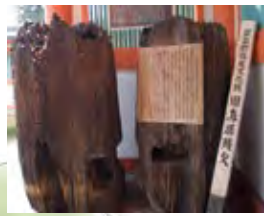
昭和8年、旧鳥居橋の橋脚工事の際に見つかった「二の鳥居」とされる柱の一部。大量の古銭とともに出土。鳥居地区の名前の由来が実証された発見であった。