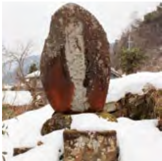
両国梶之助の石碑

体が大きく足腰の強い相撲取りは、昔の人々にとってその強さにあやかりたい特別な存在だったのだろう。協力…新温泉町教育委員会 参考文献…鳥取市ホームページ「鳥取市の指定文化財」