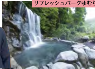
リフレッシュパークゆむら

湯村民は大人70円、子ども40円、80歳以上は無料とお得に入浴できる。(左) 温泉熱を活用して発電したエコな電力を使用。