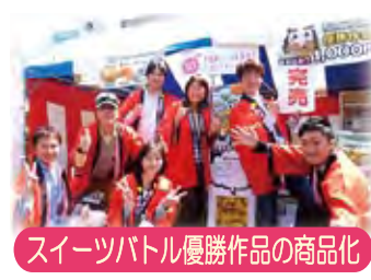
スイーツバトル優勝作品の商品化