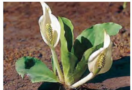
(上) 神鍋高原の桜並木/豊岡市 (中央) 泰雲寺のしだれ桜/新温泉町 (下) 加保坂ミズバショウ公園/養父市