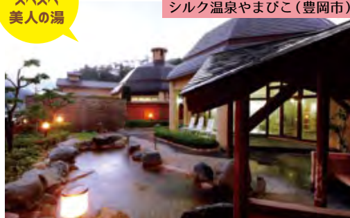
シルク温泉やまびこ(豊岡市)

地下1,100m、約7,000万年前の花崗岩と蛇紋岩の境界から毎分約300ℓが湧出している。