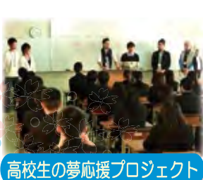
高校生の夢応援プロジェクト