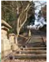
寺院の裏山には石仏を巡る曼荼羅の道が続く。