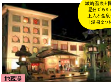
城崎温泉を開いた道智上人の忌日である4月23・24日は上人と温泉への感謝を捧げ「温泉まつり」が開催される