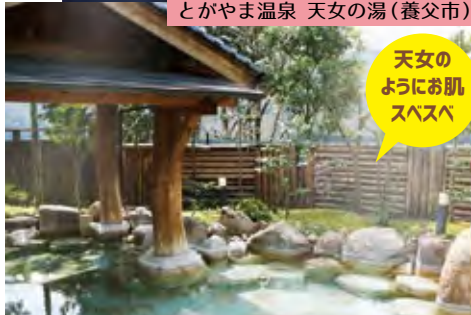
とがやま温泉 天女の湯(養父市)