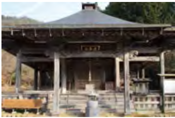
高野山真言宗「応峯山 総持寺」は山名氏ゆかりの寺院。観音堂には本尊の十一面千手観音が祀られている。応仁の乱の西軍総帥として有名な持豊(宗全)が合戦の際に常に所持していた聖観音像が胎内仏として納められている。

毎年5月5日、少年会（中学生）によって行われる「幟まわし」は、天日槍命が瀬戸を切り開いて引き