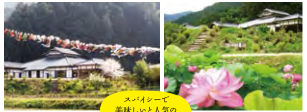
スパイシーで美味しいと人気の黒豆入りごぼうカレー

「地元の“宝”を活かして地域を盛り上げたい」との思いで、4～5月は「こいのぼり」、7月は「はすまつり」の開催やホテルのPRなどのイベントを積極的に行っている。グルメにもこだわっており、オリジナルの「黒豆入りごぼうカレー」は野菜のみを使用。