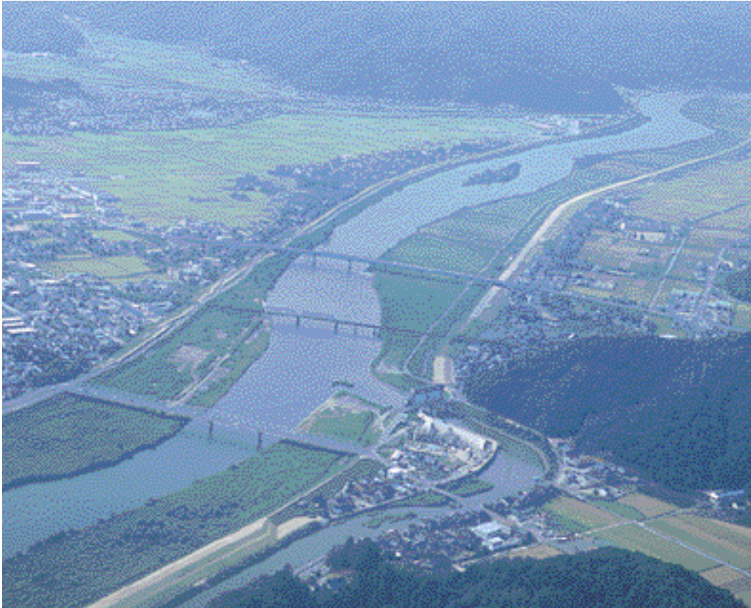
豊岡市上空から城崎方面を望む。六方水門あたり。

円山川は但馬を南から北へと縦断し、日本海への流れる母なる川として親しまれてきました。円山川という名は、源流がある生野町円山の地名をとったものです。昔は大川とが、丸川といふのが、円山川本流をさす呼び名でした。円山川という呼び名も、江戸時代にさかのぼるもので、歴史のある名前なのです。但馬で最大の川である円山川の長さ、本流だけで68kmで兵庫県下で5番目。95の支流をあわせると延長489kmの1級河川です。生野・朝来・山東・和田山・養父・八鹿・白高・豊岡・城崎（大屋・関宮・但東・出石）の1市12町を潤し、延べ流域面積は1300平方キロメートルになり、但馬全面積の61%を占め、加古川に続いて2番目です。