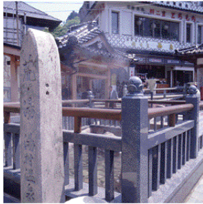
荒湯は湯村温泉の中心となり、観光客がたえない。