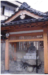
湯村温泉を開湯したと伝えられる慈覚大師像。