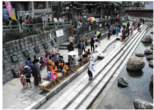
日本一長い足湯が湯村温泉に誕生しました。

浮かべる「ユーク」な名称ですが、実は温泉町は高原大根の生産地として有名なのです。主に京都の市場に出荷されているブランド名は、畑ヶ平大根といえます。年間5カ月は雪でとざされる標高約1000メートルの高原で、栽培されるこの大根は、きめが細かくみずみずしい。太すぎず細すぎず、ほどよい長さ・太さのとてもおいしい大根です。この畑ヶ平大根のように、まっすぐに健康にみずみずしく、まっ白にきれいにのびていきたい！という思いから、この名称が決まりました。親しみやすく楽しい名前なので、人気者になりそうですよね。 4月におこなわれたオープニングイベントでは、日本一長い足湯に、いったい何人の人が一度にあたたまることができるとの大会がおこなわれ、74人の日本記録が樹立され、おおいに盛り上がりしました。 豊富な湯を使った足湯は、いつも40度の湯で満たされています。家族みんなで入ってもらっても、ゆっくりと並ぶことができるので、ファミリーにもぴったり。荒湯付近の夜のライティングも少しずつ整備される予定です。新しい湯村温泉を満喫してみてくださいませんか？ 協力：温泉町役場企画観光課