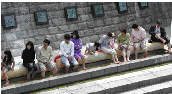
ずらりと並んで足湯を楽しもう！