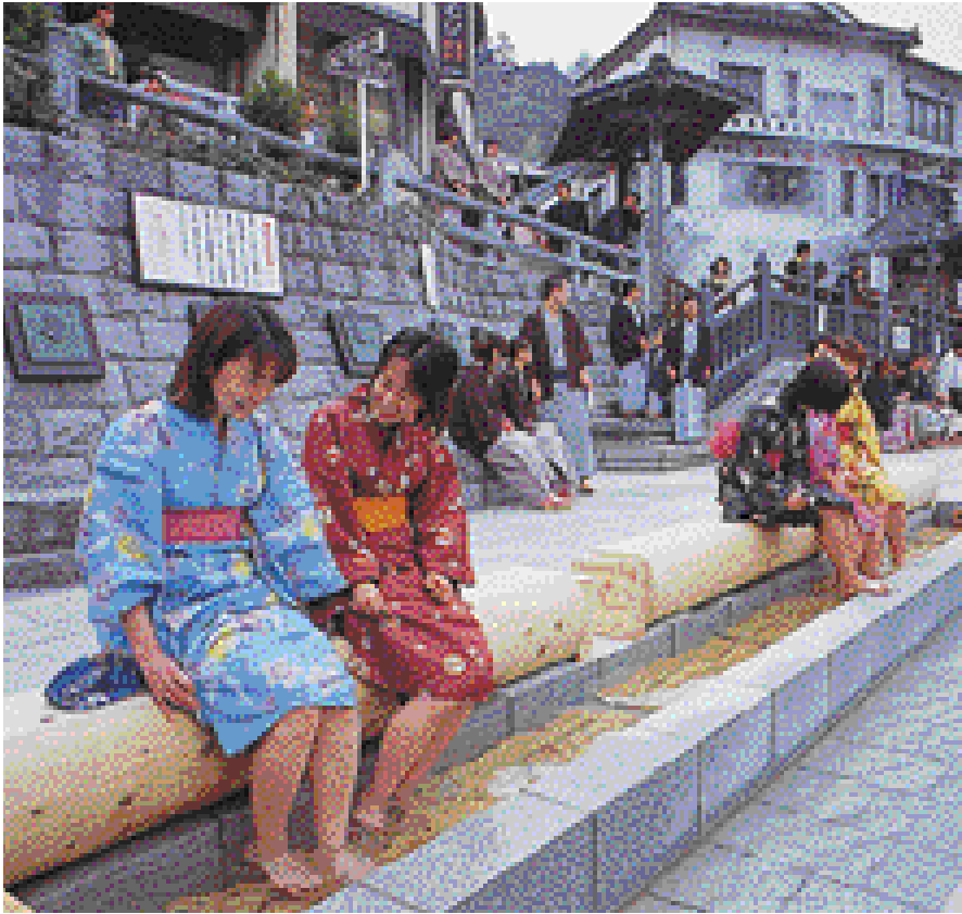
新しくできた足湯でくつろぐゆかた美人たち。