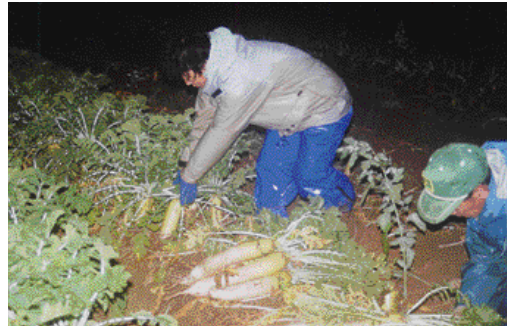
畑ヶ平大根の収穫風景。