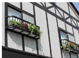
花を飾ったりと彩りを添えています。