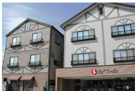
窓枠など高原リゾート風の建物に工夫されています。