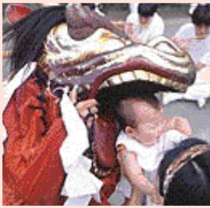
大きな口でがぶり、獅子に子どもの顔を噛んで もらおうと健康に育つと言われてます

(大花火大会) 8月18日(土)~19日(日) 山東町内各所 (問)山東町産業課 TEL.0796-76-2080